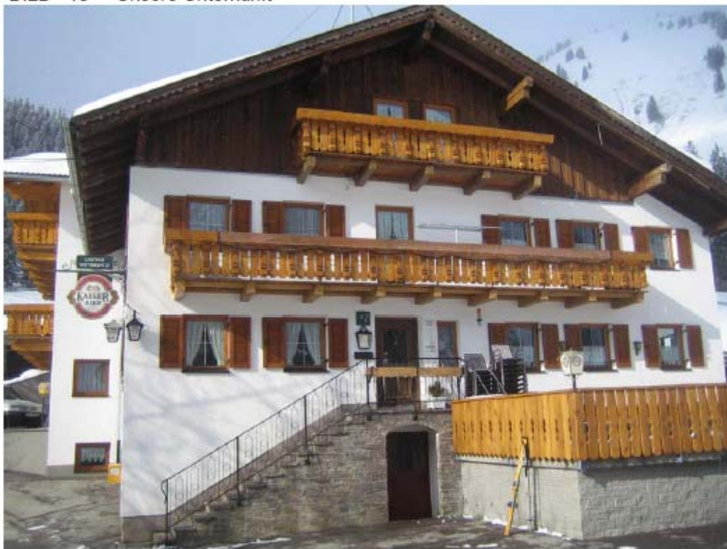
BILD 16 Unsere Unterkunft