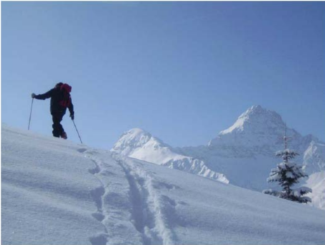
BILD 11 Aufstieg zur Engelsspitze