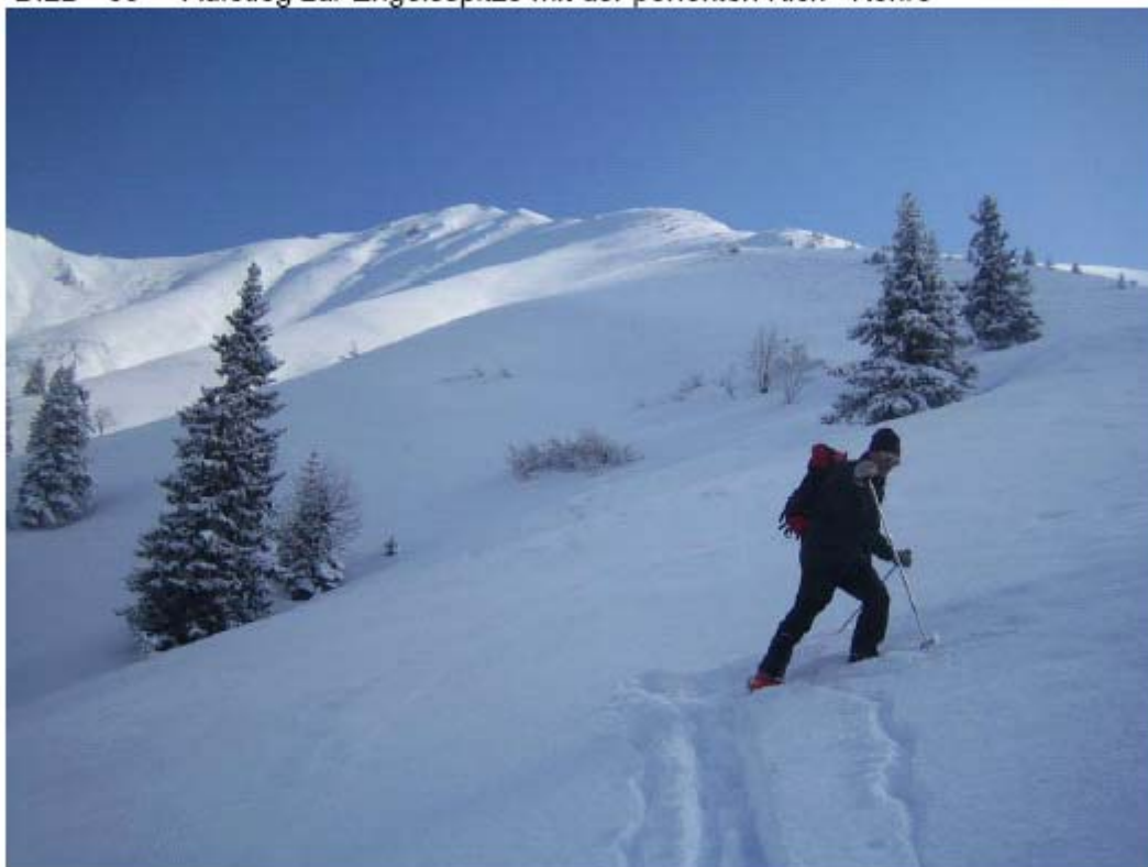
BILD 10 Aufstieg zur Engelsspitze