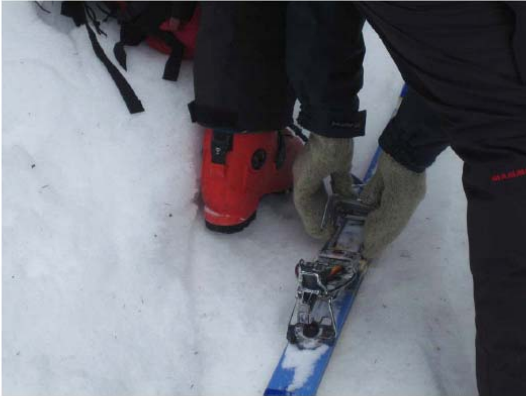
BILD 03 Harscheisen werden angelegt