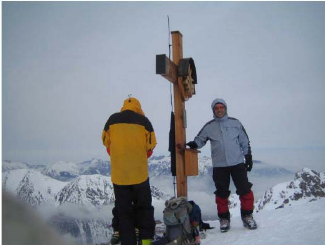
BILD 05 Gipfelkreuz an der Steinkarspitze