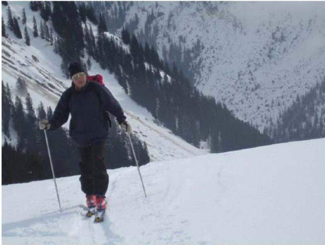
BILD 01 Aufstieg zur Steinkarspitze