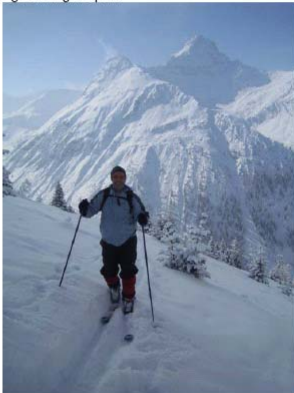
BILD 12 Aufstieg zur Engelsspitze