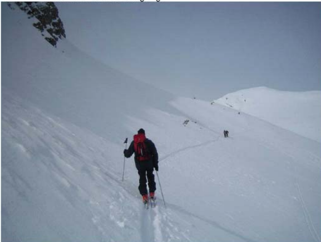
BILD 04 Aufstieg zur Steinkarspitze