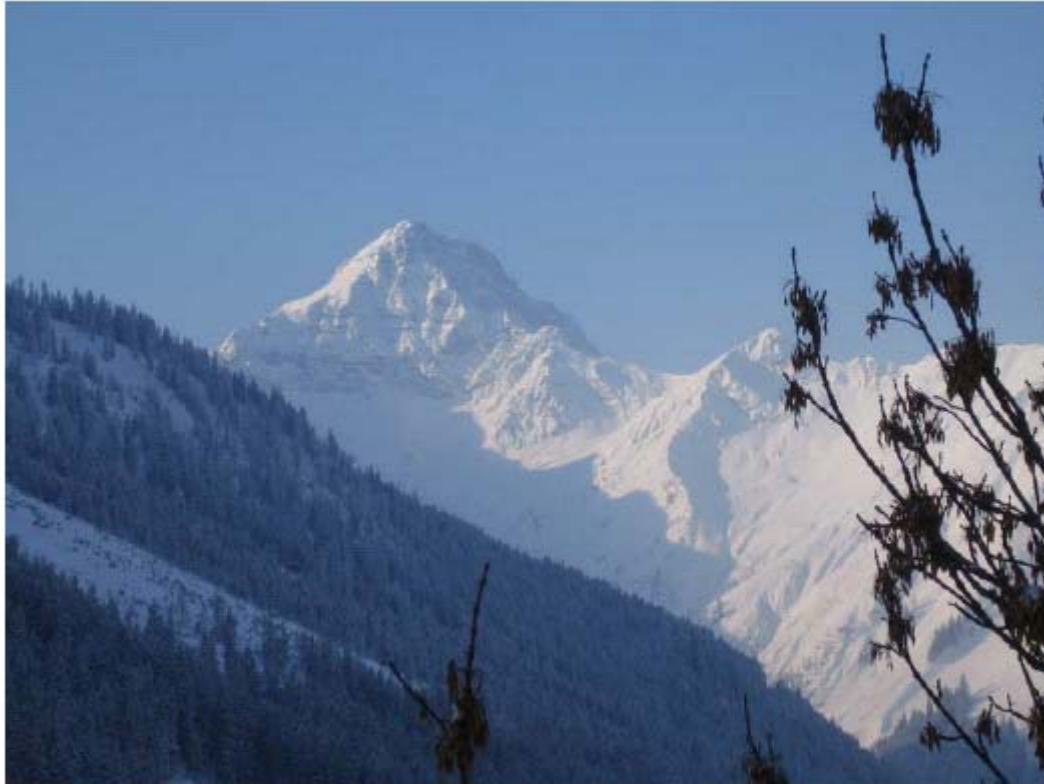
BILD 17 Unsere Unterkunft mit Blick auf die gleichnamige Wetter Spitze