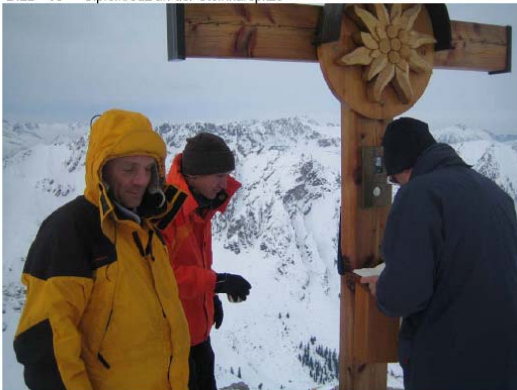
BILD 06 Gipfelkreuz an der Steinkarspitze