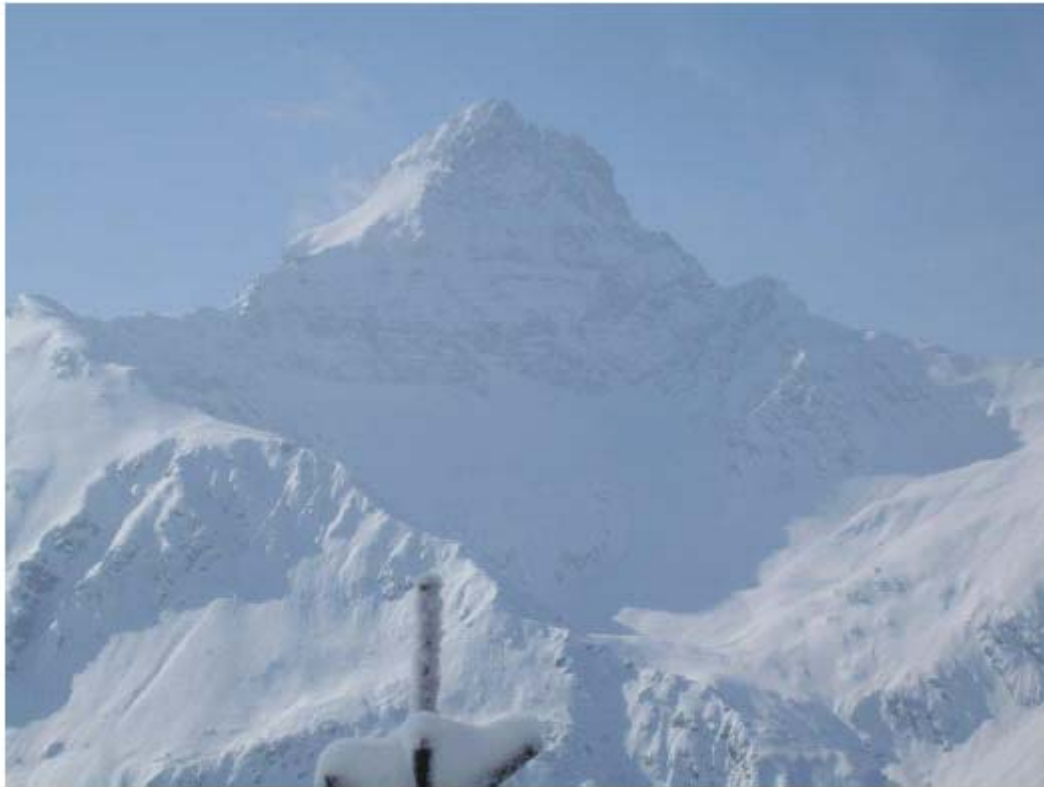
BILD 13 Wetterspitze vom Aufstieg zur Engelsspitze aus fotografiert