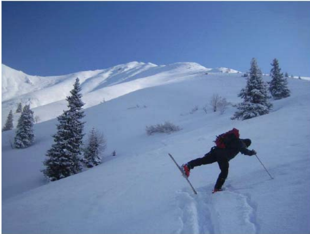
BILD 09 Aufstieg zur Engelsspitze mit der perfekten Kick - Kehre