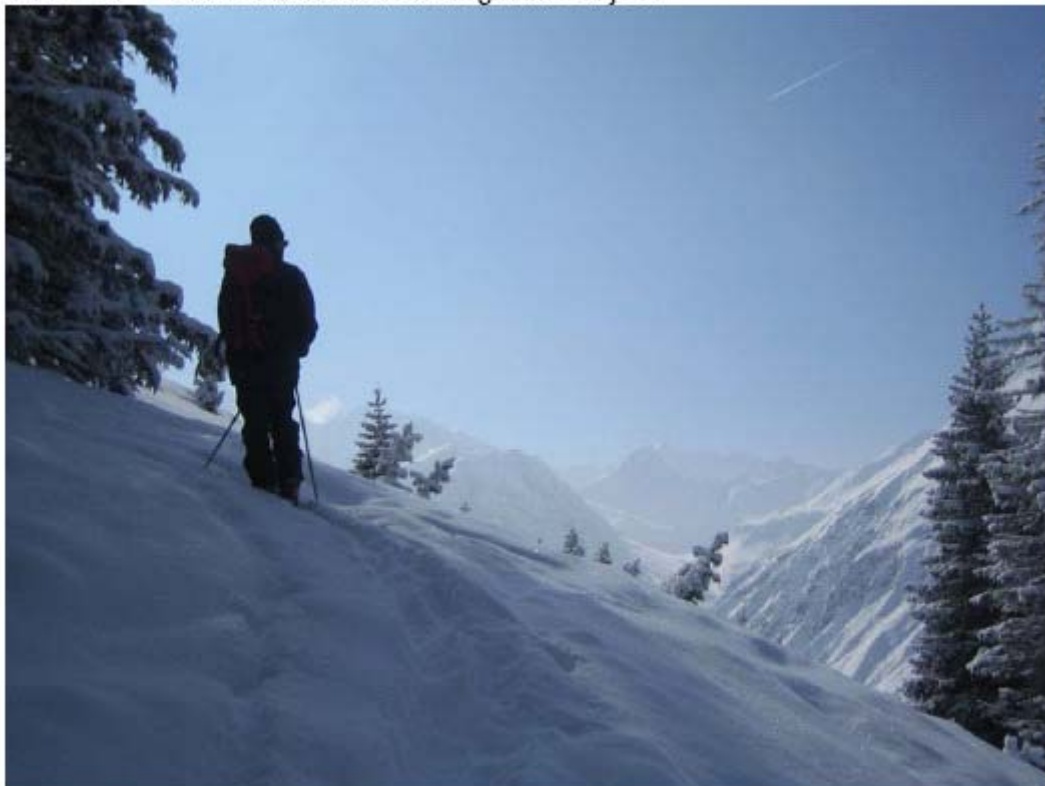
BILD 08 Aufstieg zur Engelsspitze