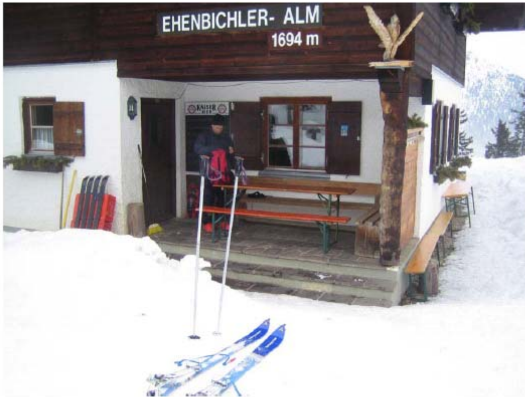
BILD 07 Jausestation auf dem Weg zum Galtjoch