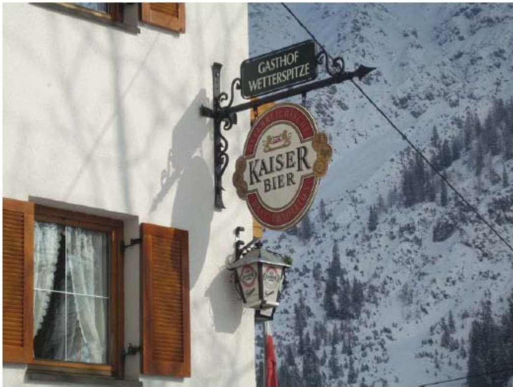
BILD 15 Unsere Unterkunft